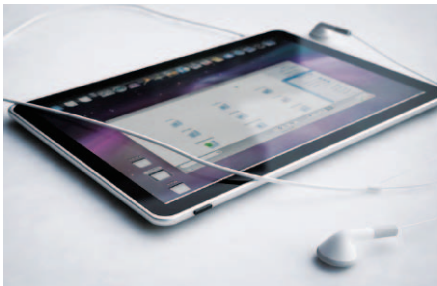
Современный планшетный компьютер

ными на сегодняшний день, по мнению профессионалов, являются всевозможные планшеты – iPad и их аналоги. iPad были официально представлены генеральным директором американской корпорации Apple Стивом Джобсом в январе 2010 года. В апреле они поступили в продажу в США по цене от 499 до 829 долларов, а в мае их начали продавать и за пределами США. В России продажи устройств начались в ноябре 2010 года, стоимость моделей iPad Wi-Fi с 16, 32 и 64 ГБ памяти составила 19 990, 23 990 и 27 990 руб. соответственно. Планшеты с таким же объемом памяти, оснащенные модулем сотовой связи 3G для работы с мобильным Интернетом, обойдутся покупателям соответственно в 24 990, 28 990 и 32 990 руб. По сообщениям ин-